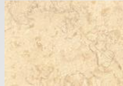
Колір Sylvia Antik