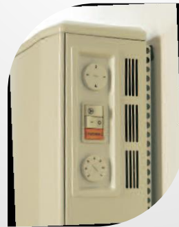
Доступна гнучка система управління