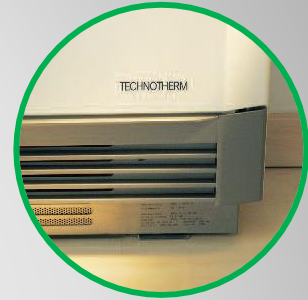
Унікальний фільтр пилу