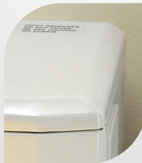
Закруглені кути з гладкими поверхнями