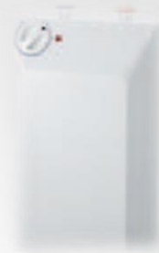
KSU 2005 5л/3010 10л бак потужність на вході 2 кВт, безнапорний,