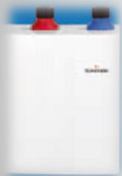
Настінний варіант Витончений миттєвий водонагрівач КДУ 3.5 кВт / 5.0 кВт Розміщення: під раковиною