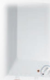
• KSO 2005 5л /3010 10л бак настінний водонагрівач •потужність на вході •2 кВт, безнапорний