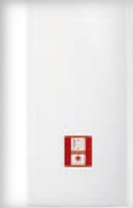
Миттєвий водонагрівач CDE Vario Select 18-27 кВт